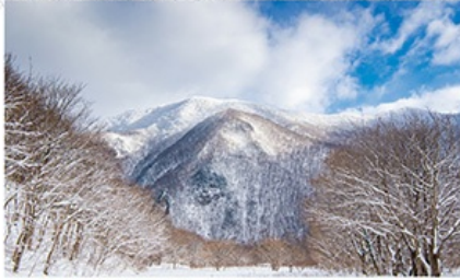
울릉도 설국 즐기기