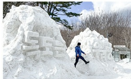
눈 조각 포토존

※ 상기사진은 2022년 나리분지 눈꽃축제 사진이며 실제와 다를 수 있습니다.